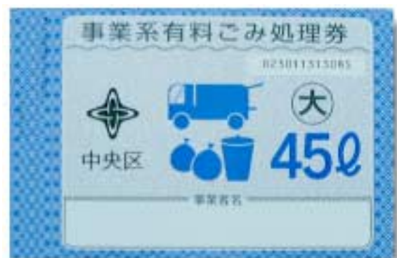
事業系有料ごみ処理券

東京23区清掃協議会では、自治体が収集するか否かの目安を、事業所あたりのごみ排出量で分けています。一日当りのごみ排出量50kg以下の場合には、指定のごみ袋に「事業系有料ごみ処理券」を貼れば自治体が収集、焼却処理してくれます。ごみ量が50kg/日を超える施設の場合には、自治体では収集せず、事業者が清掃工場に直接持ち込むか、一般廃棄物運搬業者に委託し清掃工場に搬送、自治体は有料でこれを受け入れ焼却処理しています。ちなみに、自治体では自治体の清掃工場に搬入できるのは一般廃棄物運搬業の免許を持った業者で、搬入する車