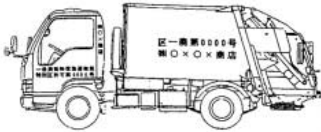
図2. 搬入車両明記例

両も一般廃棄物としての許可番号と会社名を明記した車両のみしか入ることはできません。言い換えれば産業廃棄物運搬業者が産廃専用の車両で自治体の清掃工場に搬入することはできないということです。