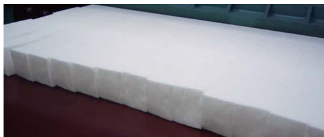
所定のサイズに裁断された晒綿