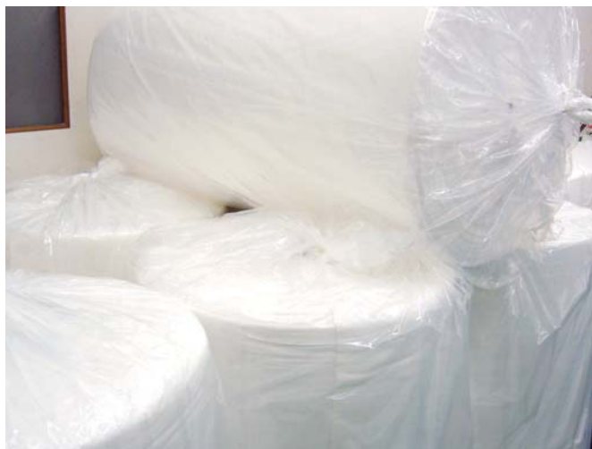
晒加工を終えた晒綿の原反

刈り取られたばかりの綿花はオイル成分に覆われているため、そのままでは水分をはじいてしまいます。化粧綿を作るためには、脱脂(脂分を取り除く作業)をはじめ、漂白、表面処理などの工程により、綿花を晒綿(さらしわた)と呼ばれる状態に加工しなければなりません。なお、晒綿加工の工程には、薬剤を用いて脱脂・漂白後、表面を整える晒工程をはじめに行う前晒(さきざらし)と、先にすき綿工程と呼ばれる綿の繊維をほぐし一定の方向に揃える作業を行う後晒(あとざらし)があります。